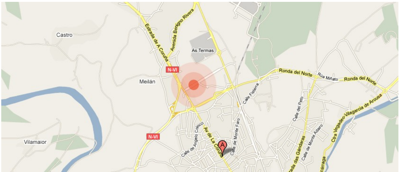
Centro de Empresas e Innovación (CEI-NODUS)